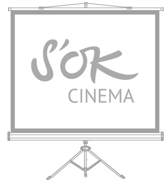
S'OK CINEMA TRISCREEN Переносной напольный экран для проектора